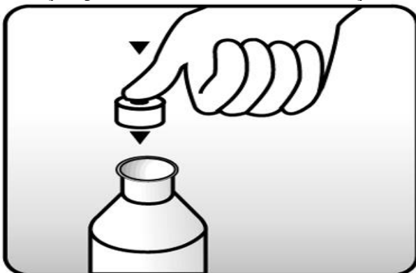
Fig. 1: coloque a tampa com orifício (batoque) no frasco.