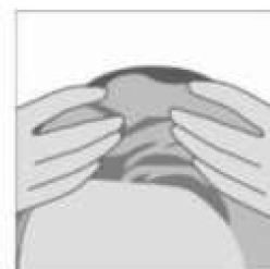
3 - Massagear o couro cabeludo através de movimentos circulares em direção à parte superior da cabeça para favorecer a micro-circulação, pentear como habitualmente, sem enxaguar.