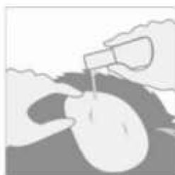
2 - Repetir a operação em todas as zonas afetadas.